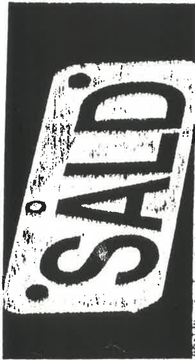
"Såld" står det på skylten framför nära hälften av tomterna. Snart startar en ny kampanj och efterfrågan är fortsatt stor.